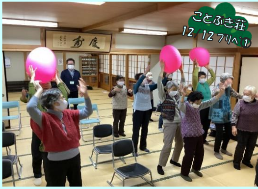
ことぶき荘 12/12 7/A 1