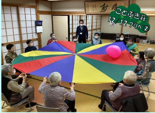
ことぶき荘 12/12 7/A 2