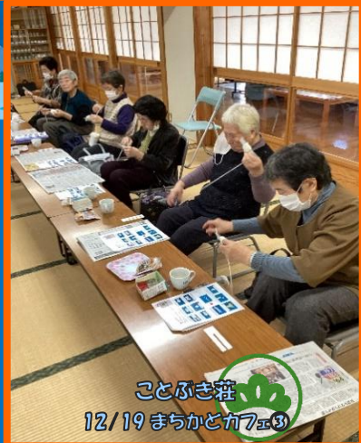
ことぶき荘 12/19 まちかどカ7E ③