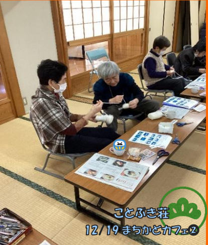
ことぶき荘 12/19 まちかどカ7E ②