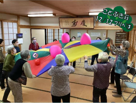
ことぶき荘 12/12 7/A 3