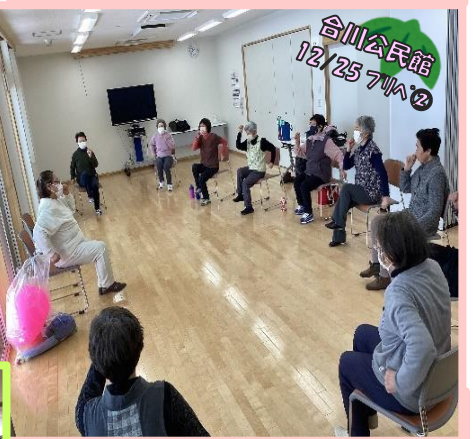
合川公民館 12/25 7/A ②