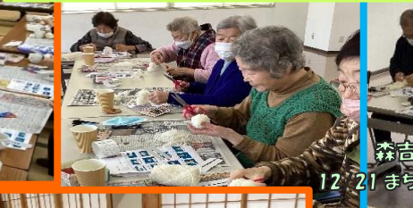
森吉公民館 12/21 まちかどカ7E ①