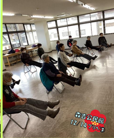
森吉公民館 12/14 7/A ③