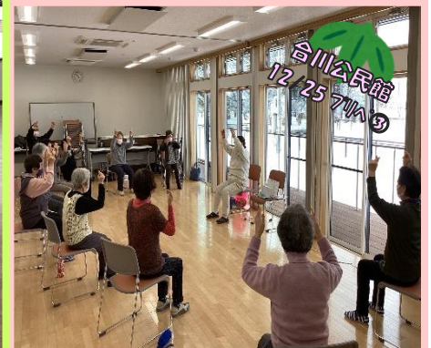
合川公民館 12/25 7/A ③