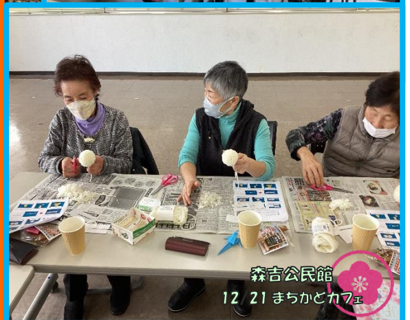
森吉公民館 12/21 まちかどカ7E