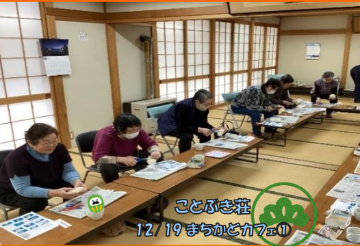
ことぶき荘 12/19 まちかどカ7E ①