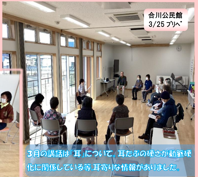
合川公民館 3/25 プリベ