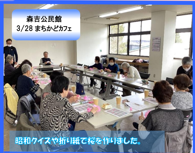
森吉公民館 3/28 まちかどカフェ