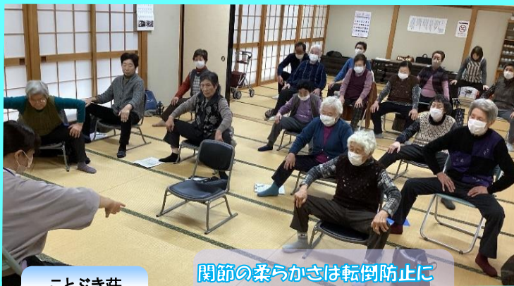
関節の柔らかさは転倒防止に つながりますよ。