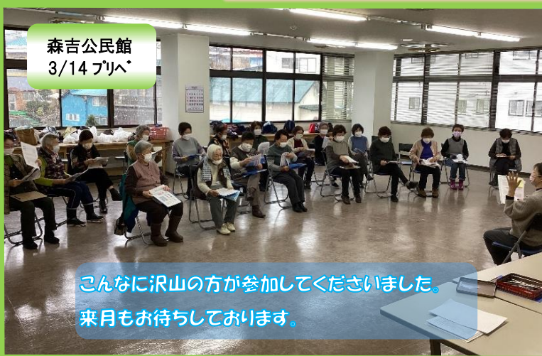
森吉公民館 3/14 プリベ