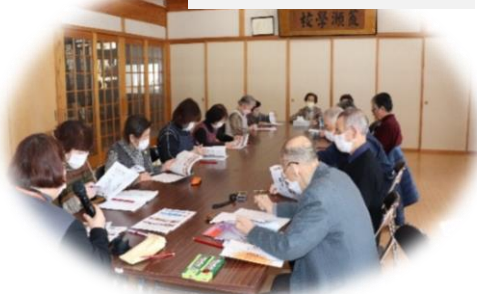
荒瀬いきいきサロン