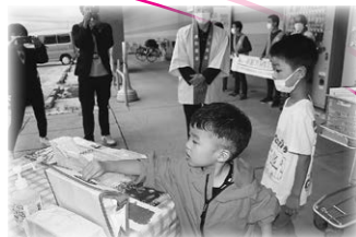
昨年度の街頭募金の様子