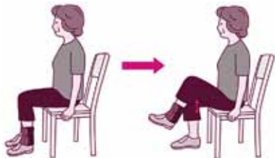
座って太もも上げ体操