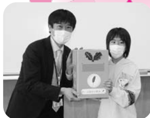
比内支援学校 たかのす校