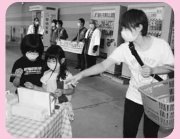
募金箱を設置して街頭募金を行いました

運動開始からこれまでの期間に、戸別募金や大口募金をはじめ、企業や法人、保育園、学校からの募金もお預かりしました。運動開始日となる10月1日には2年ぶりとなる「街頭募金」も実施し、多くの助成団体や関係者の方々にご参加いただきました。募金は、様々なかたちで地域づくりへと循環されていきます。