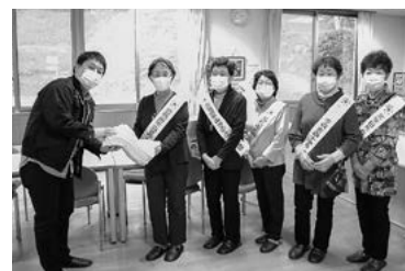
森吉地区日赤奉仕団様より タオルを寄贈いただきました