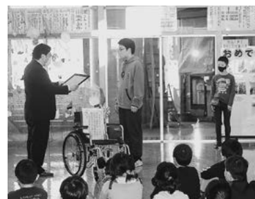
鷹巣東小学校様より 車いすを寄贈いただきました