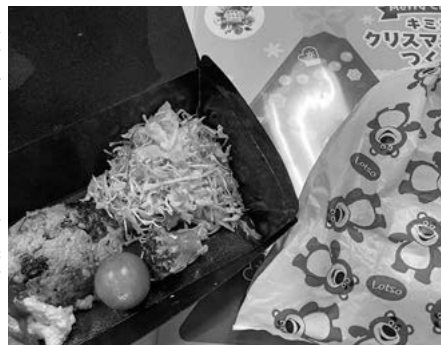
寄付でいただいたお菓子も子どもたちに喜ばれています